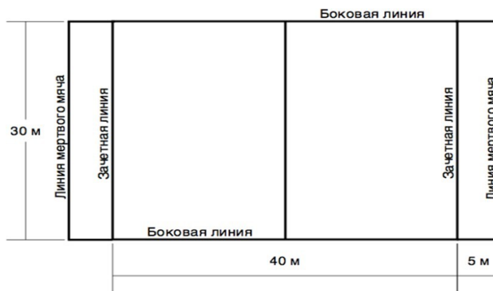
Рисунок 1 - Разметка площадки для игры тэг – регби

Линия зачетного поля - линия, за которую нужно приземлить мяч или забежать с мячом (если это предусмотрено правилами)